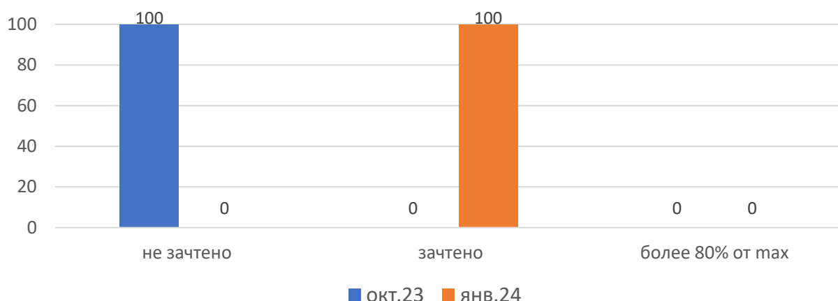
Рисунок 1. Основные результаты ДР по биологии

На рисунке 1 представлены основные результаты ДР по биологии в МСУ. В октябре 2023, январе 2024 г. в МСУ не было участников, набравших максимальный балл.